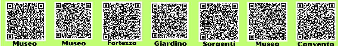
Museo Miniera Museo olio Fortezza Radicofani Giardino Daniel Spoerri Sorgenti del Vivo Museo Abbazia Convento San Bartolomeo