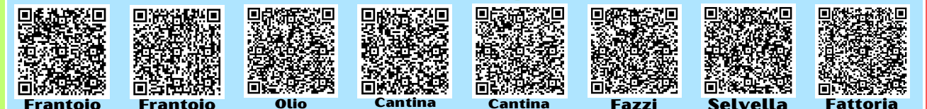
Frantoio Vabro Frantoio Borselli Olio Abbraccio Cantina Bakkanali Cantina Amiata Vini Fazzi Castagne Selvella Fattoria Didattica