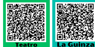
Teatro Piancastagnaio La Guinza