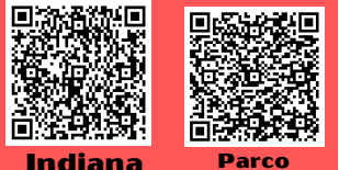
Indiana Park Parco Faunistico